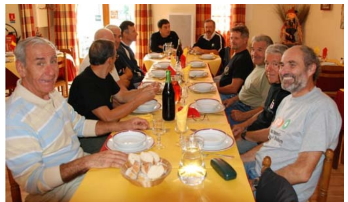
....mais aussi un bon coup de fourchette !!